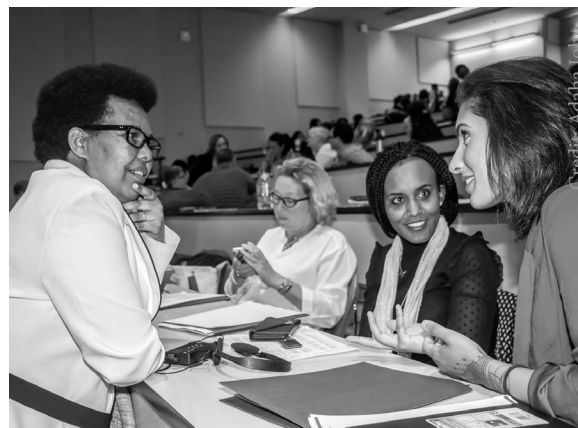
Des participantes au Colloque international sur les droits des réfugiés, Toronto, juin 2018.

Consultation pancanadienne : Dans le cadre de notre Consultation d'automne 2017 à Niagara Falls, nous avons formulé des recommandations à l'intention du ministre de la Sécurité publique, Ralph Goodale, suite à son allocution.