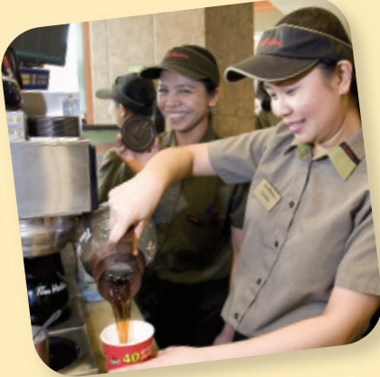
Des travailleuses dans un restaurant rapide en Alberta

Frais de recrutement exorbitants, heures supplémentaires imposées et non rémunérées, conditions de travail dangereuses, piètres conditions de vie... Ce ne sont là que quelques exemples des nombreux abus subis par des travailleurs migrants au Canada.