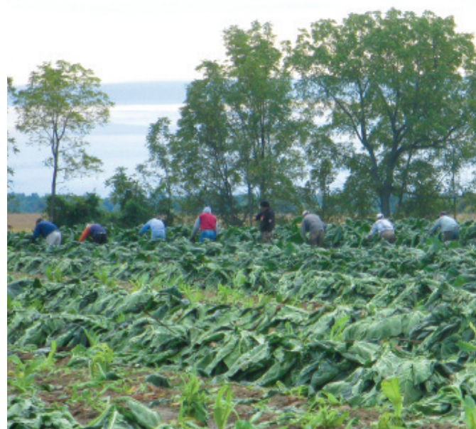
Travailleurs migrants agricoles près de Leamington, Ontario cueillant des feuilles de tabac.

Le Manitoba a déjà établi un précédent avec sa Loi sur le recrutement et la protection des travailleurs.